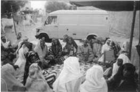
Transport für schwangere Frauen in Mauretanien